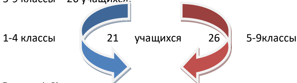
Рисунок 1: Качественная и количественная характеристика учащихся